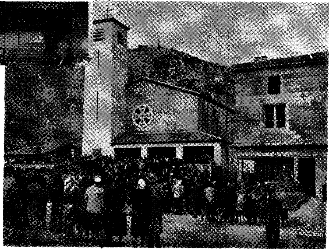
La foule des fidèles devant le nouveau Temple

avoir remercié le maire du Pouzin de son témoignage, marquera que « cette communauté entend vivre dans la paix et aussi dans une sainte émulation avec tous, croyants et non croyants ». Puis, il assurera que les protestants n'ont pas d'autre but que la pacification des cœurs, pas d'autre ambition que d'être à la fois de bons chrétiens et de bons citoyens.